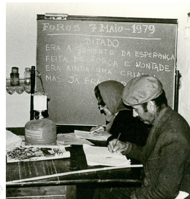
* - Campanha de alfabetização para adultos em 1979